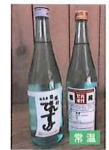
【限定50セット】 ■日本産で仕上げた本 ■葛尾村産 星野のつよさき酒 ■常温使用