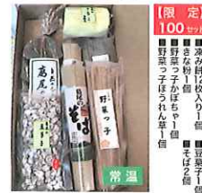
【限定100セット】 ■菜少餅2枚入り1個 ■きな粉1個入り1個 ■そば2個 ■野菜つ子ほろりん草1個 ■野菜つ子ほろりん草1個