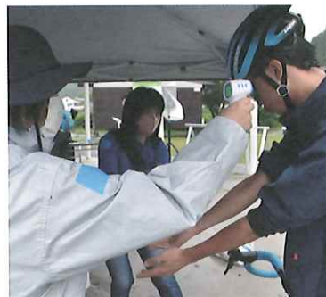
検温・アルコール消毒の徹底

ツール・ド・かつらおの第6回福島民報杯は6月27日、28日の2日間、村内公道で開催されました。開催に伴い、参加選手への2週間の検温記録や来場者の検温、マスク着用、アルコール消毒の徹底など新型コロナウイルス感染症対策をしっかりと実施しました。交通規制を伴う大会のため、ご迷惑をおかけしましたが、皆様の多大なるご協力とご理解により、盛況で終わることができました。感謝申し上げます。