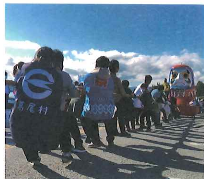
▲標葉祭り「巨大ダルマ引き」の様子