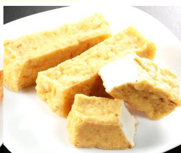
地場産青肌都路豆腐 地場産都路豆腐