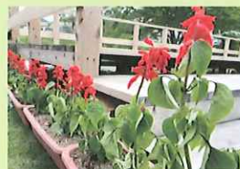
▲葛尾村生活研究グループ