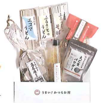
かつらおの逸品セット 4,100円