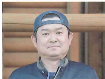
もりもりランド 管理人