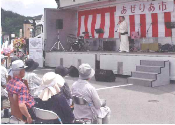
▲ステージイベント