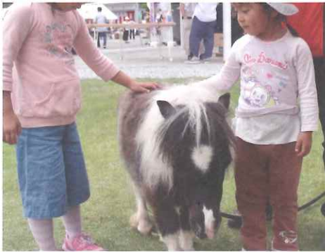
▲動物との触れ合い