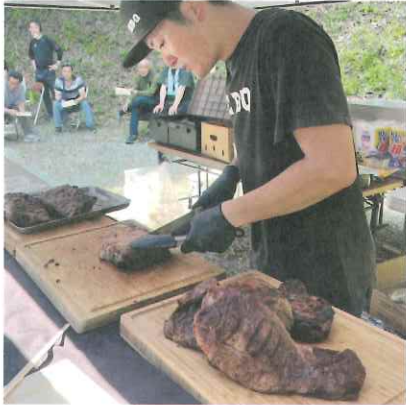
▲焼けた羊肉をカットする様子