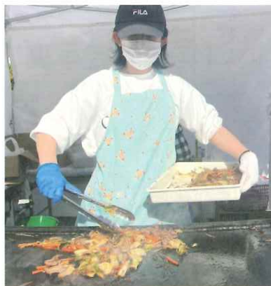
▲盛り付けている様子