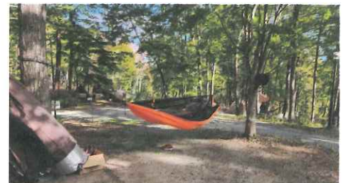
▲もりもりハンモックイベント