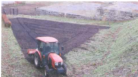
▲菜の花の種まきin大尽屋敷(草刈り隊)