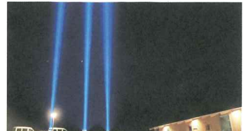
▲光のモニュメント