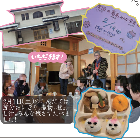
2月1日(土)のこんだてでは節分おにぎり、煮物、澄まし汁。みんな残さずたべました!

子どもは、ボードゲームやトランプで楽しんでいました。保護者や住民の交流が自然に生まれ、和やかな雰囲気でした。保健師やKatsurao Collectiveのスタッフも積極的に交流し、参加者同士が顔を見ながらゆつくり話せる温かな場となりました。