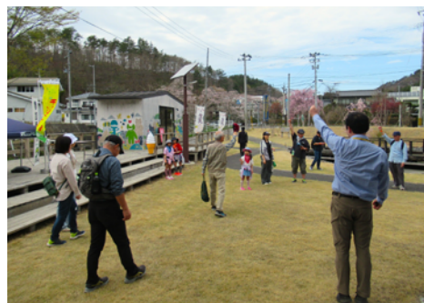
▲あるけあるけ大会