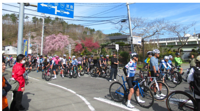
▲ツール・ド・かつらお スタートの様子