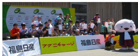
▲ツール・ド・かつらお 表彰式