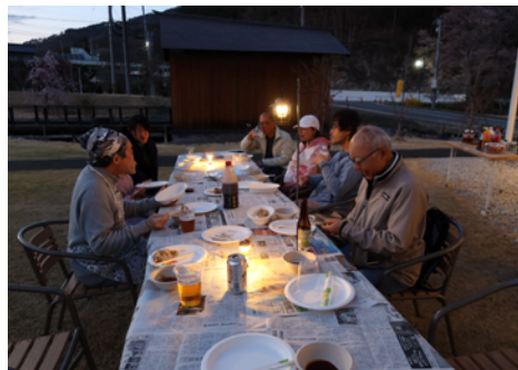
▲前夜祭バーベキューの様子

当大会の運営にあたり、交通整理員として多くの村民の皆さまのご協力もと、大会が成り立っておりますので、今後ともご協力頂きますと幸いです。地域に活力を呼び込む大会として、今後もより良い大会を目指して行きます。